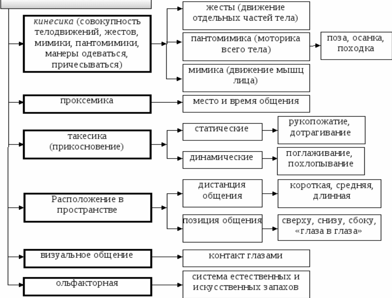
Рисунок 2. Структура невербальной коммуникации